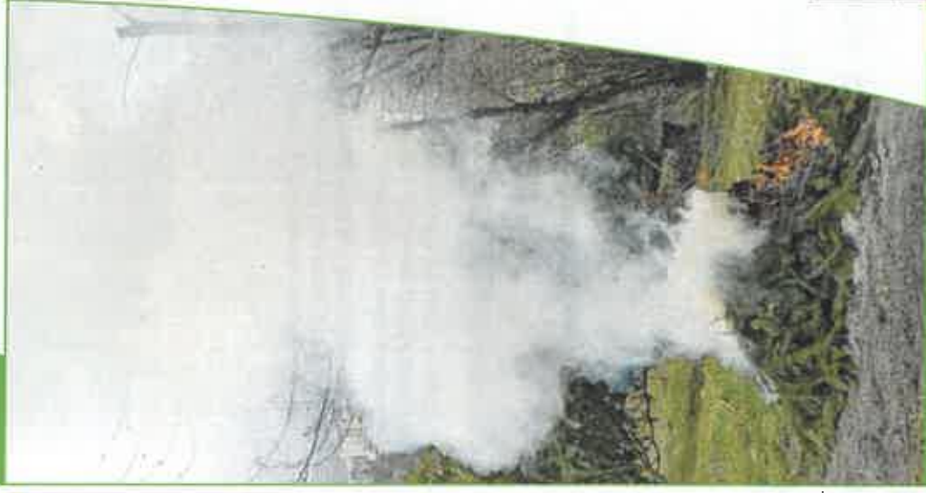
DESA Rhône-Alpes - DR/COM - Février 2013