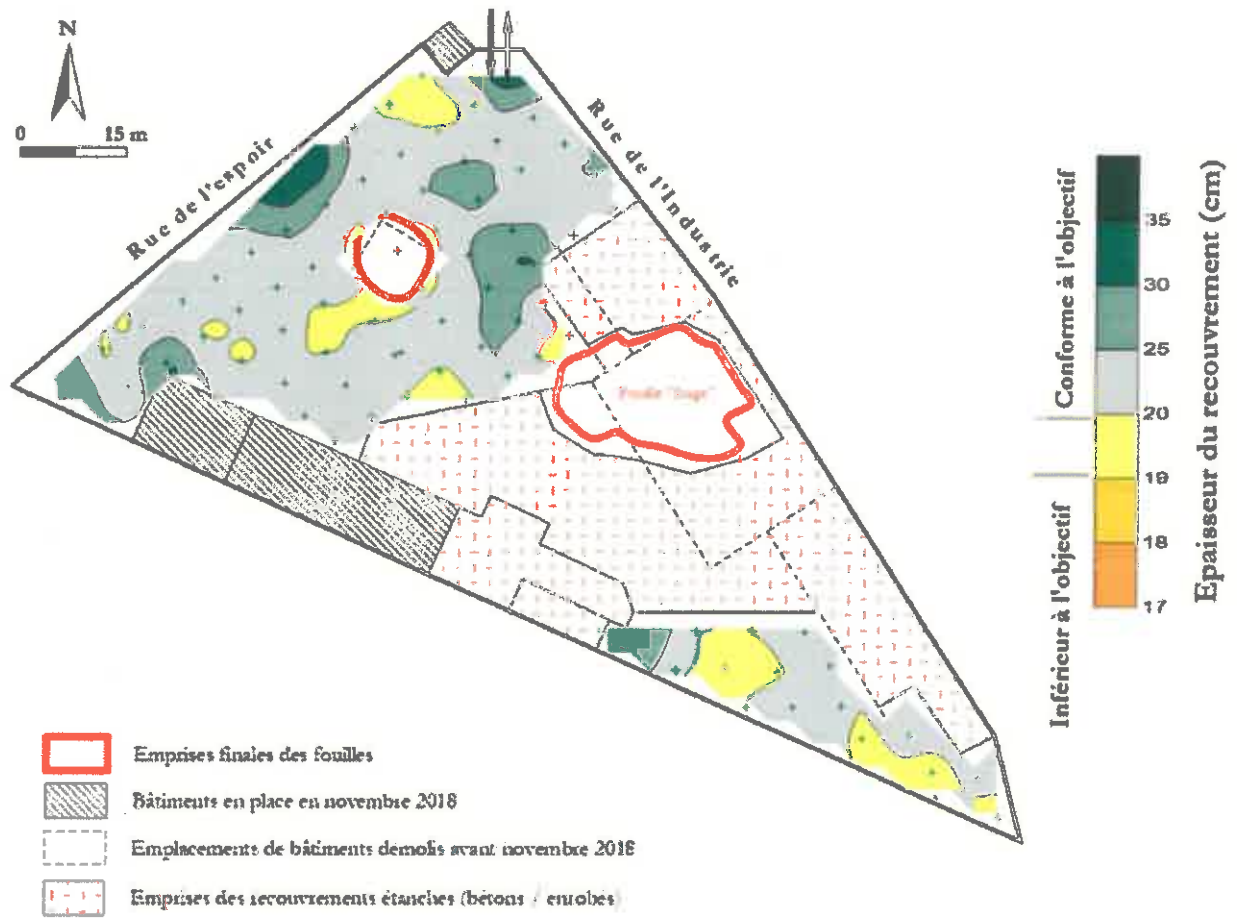
Figure n°15 : Modélisation de l'épaisseur du recouvrement.